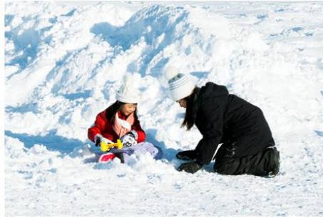
Playing in the snow