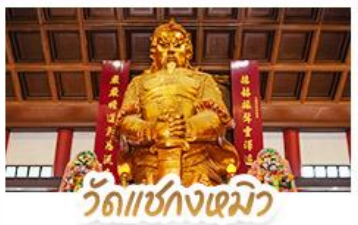
วัดเซกงเมี้ยว