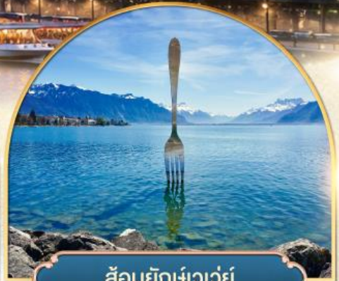
ล้อมยักเขาวัว