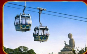
กระเช้านองปิง