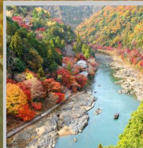
“ARASHIYAMA MT. KAMEYAMA”