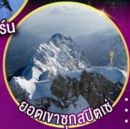
ยอดเขากุสปีตเซ