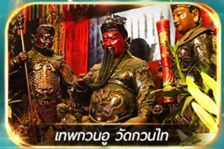
เทพกวนอู วัดกวนไท

พามุไหว้พระขอพร 8 วัดดัง, อิสระช้อปปิ้ง 1 วันเต็มแบบจุใจ