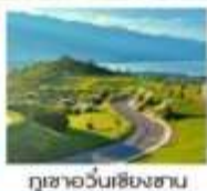
กุเขาวุ้นเซียงชาน