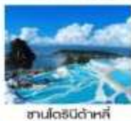
ซานโตรินี่ด้าหลี่