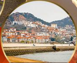
ซาจี้โข่ว