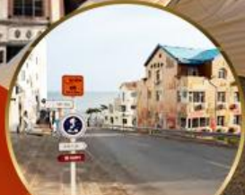
ถนนอ่าวจีป่า