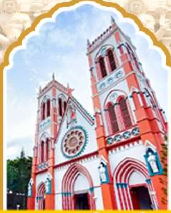
ปอนตีเซอรั