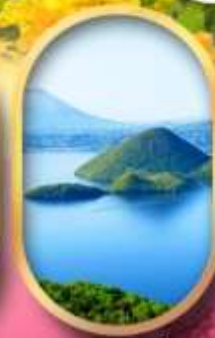
วิวทะเลสาบโทโยะ