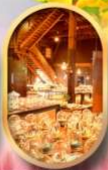
พิพิธภัณฑ์ถ้ำถ้ำออนเซ็น