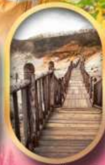
หุบเขาจิกุกาชิ