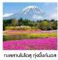
ทะเลสาบโมโตสุ ทุ่งพืชมอส