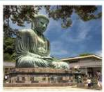
วัดโศโตคุอิน

SHIRAKAWAGO JAPAN ALPS MATSUMOTO KAMIKOCHI FUJI KAMAKURA