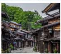
หมู่บ้านโบราณนารายิ จุกุ