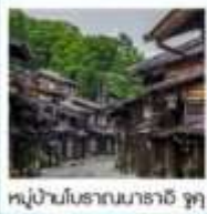
หมู่บ้านโบราณนาราอิ จุกุ