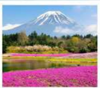
ทะเลสาบโมโตสุ ทุ่งพืชมอส