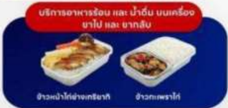
บริการอาหารร้อน และ น้ำดื่ม บนเครื่อง ยาไป และ ขากลับ