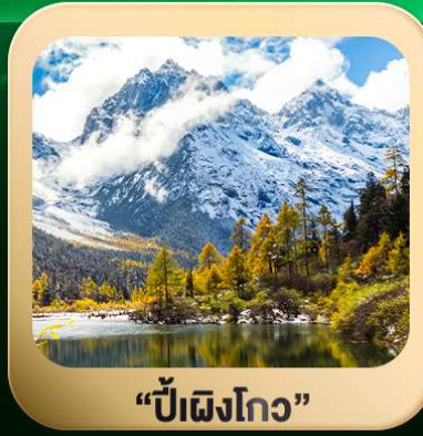
“ปี้ฝิงโกว”

ชมธรรมชาติ 2 อุทยานขึ้นชื่อ อุทยานภูเขาสี่ครุณี + อุทยานปี้ฝิงโกว สะพานหนานเฉียว • ถนนคนเดินไท่กู่หลี่ + ซุนซีลู่ + Pop Mart • ดงเจียวจื่อ