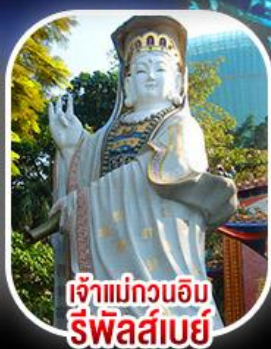
เจ้าแม่กวนอิม รีพัสลีย์