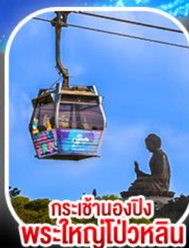
กระเช้าเองปีง พระใหญ่โป่วหลิน