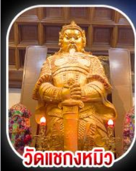
วัดเขกหมิว