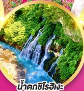
น้ำตกชิโรฮิเมะ