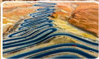
ถนนผานหลงกู่ต้าอว