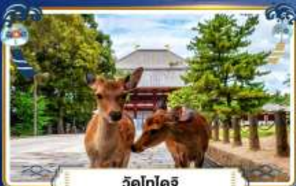
วัดโทไดจิ