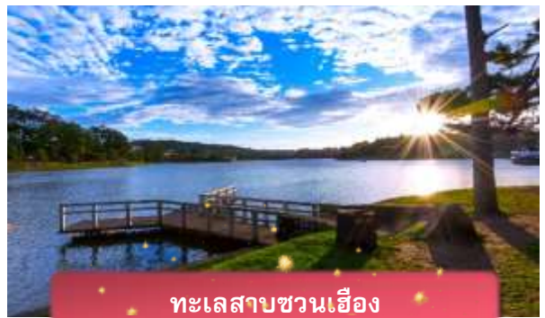
ทะเลสาบชวนเอื้อง

ที่พัก The Western Hill ระดับ 4 ดาวหรือเทียบเท่า