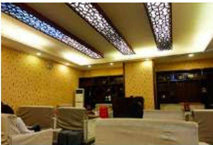
ศูนย์แพทย์แผนจีน

อัตราค่าบริการสำหรับโปรแกรมเสริมการแสดงชุด The love Story of Wooden man and Fairy Fox ท่านละ 400 หยวน (หรือประมาณ 2000.-บาทขึ้นอยู่กับอัตราแลกเปลี่ยน) ระยะเวลาที่ใช้ในการเที่ยวชมการแสดง ประมาณ 3 ชั่วโมง รวมเวลาเดินทางไปกลับค่าบริการรวม ค่าบัตรเข้าชม ค่ารถรับ ส่ง และค่าน้ำเที่ยวของไกด์ท้องถิ่น