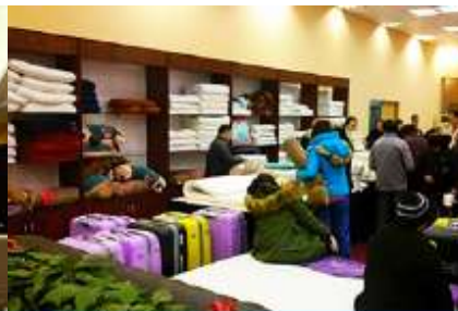
ศูนย์จำหน่ายผลิตภัณฑ์ยาพารา