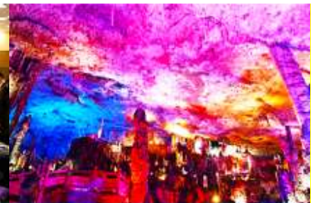
เก้าเก้าสวรรค์จิวเกียนต้ง