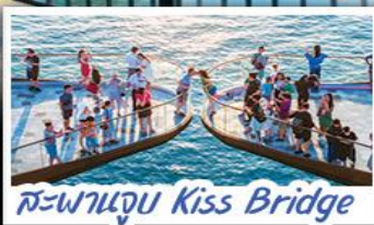
สะพานจูบ Kiss Bridge