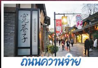
ถนนควานจ้าย