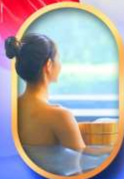
พักโรงแรมออนเซ็น