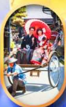
ศาลเจ้าจิ้งจอก