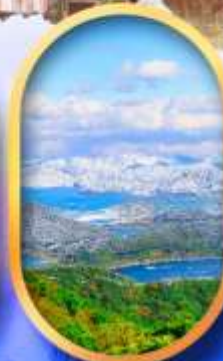
ทะเลสาบมิกะตะ