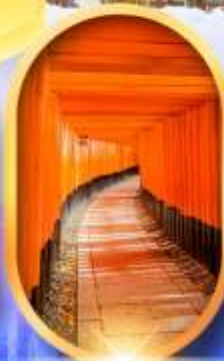
เมืองเก่าทาคายาม่า