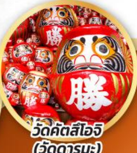
วัดคิตสึโองิ (วัดดาร์มะ)

ชมความงามของกำแพงหิมะ เส้นทางสายอัลไพน์ ทากะยาม่า (JAPAN ALPS SNOW WALL)