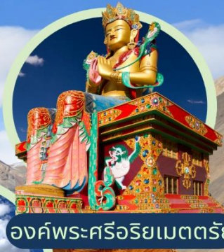
องค์พระศรีอริยเมตตรีย์