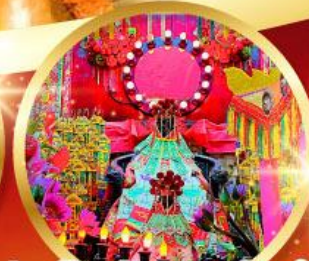
วัดเจ้าแม่กวนอิมฮ้องฮำ