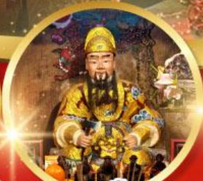
วัดแซกง 600ปีหยุนหลอง