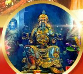
วัดปักไต้ฮ้องฮำ