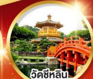
วัดซีหลิน (สวนหนานเหลียน)