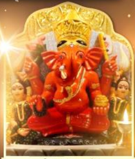
องค์สิทธีวินายก