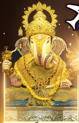
องค์ดีกษุท์เศษฐ์