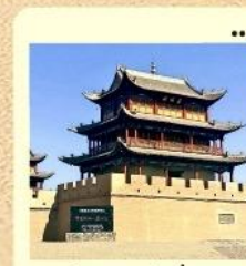
กำแพงเจียยี่กวน