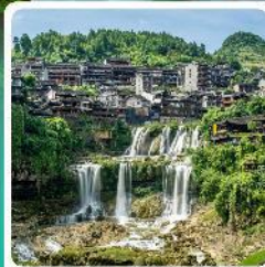
ฟู่หลงเจิน