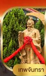
เทพจันทร่า

พิเศษฟรี! ลงห้องลับหวังต้าเซียน รวมกระเช้านองปิง