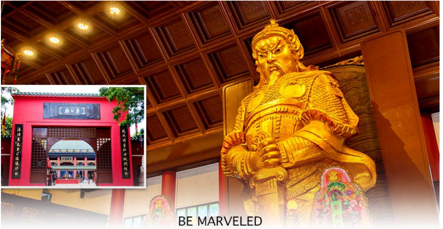
BE MARVELED วัดแขก