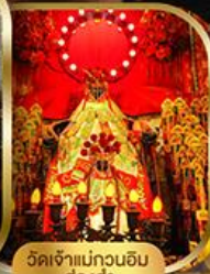
วัดเจ้าแม่กวนอิม ฮองอ่า