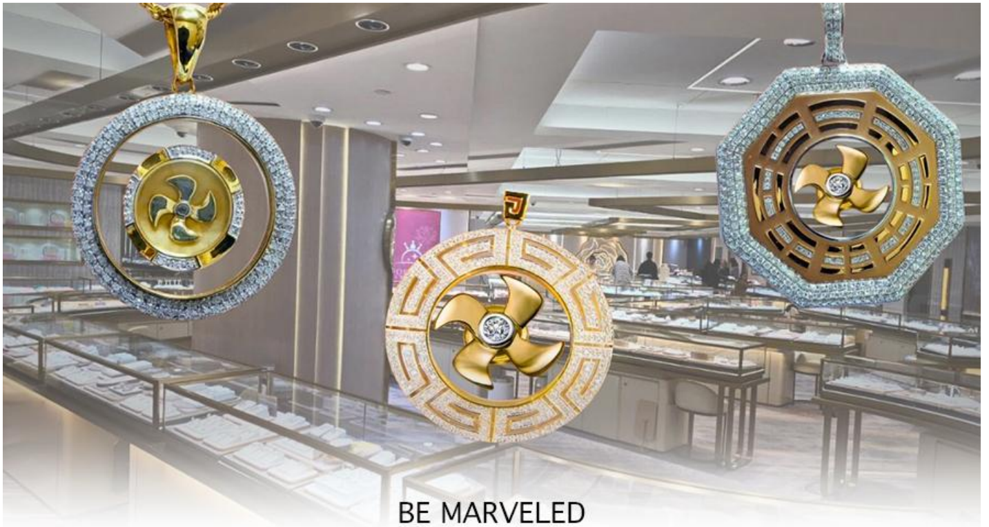
BE MARVELED ศูนย์ฮวงจุ้ย กัมพันนครบุรี

นำท่านชม ศูนย์ปีเจียะ ซึ่งคนจีนนับถือว่าหยกเป็นหิน ที่เป็นตัวแทนของความสวยงามและความบริสุทธิ์มีความเชื่อว่า หยก มงคล ถ้าพกติดตัวไว้จะอายุยืนและสุขภาพดีมีสินค้าน่ามากมายเกี่ยวกับหยก อาทิ กำไลหยก หรือสัตว์นำโชคอย่างปี เจียะ ให้ ท่านได้เลือกซื้อเป็นของฝาก, ของที่ระลึก หรือของนำโชคแต่ตัวท่านเอง