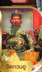
วัดกวนอู