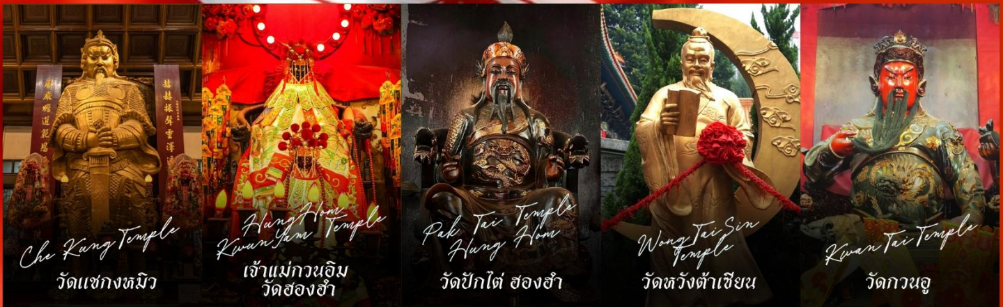
Che Kung Temple วัดแซงกทมิว

รายการทัวร์ข้างต้นอาจมีการปรับเปลี่ยนเพื่อความเหมาะสม