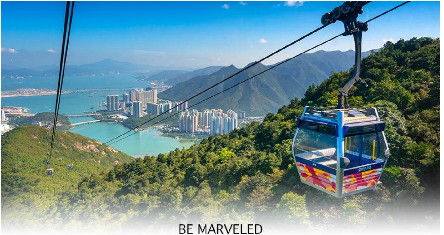
BE MARVELED กระเช้านองปิง

สงวนสิทธิ์ในการเปลี่ยนเป็นใช้รถโค้ชของทางอุทยานในการเดินทาง เพื่อนำท่านขึ้นสู่หมู่บ้านวัฒนธรรมนองปิง บนเกาะ ลันเตาแทน**) จากนั้นนำท่านไปสักการะ (พระใหญ่เกาะลันเตา หรือ พระพุทธรูปเทียนถาน (TIAN TAN BUDDHA STATUE)