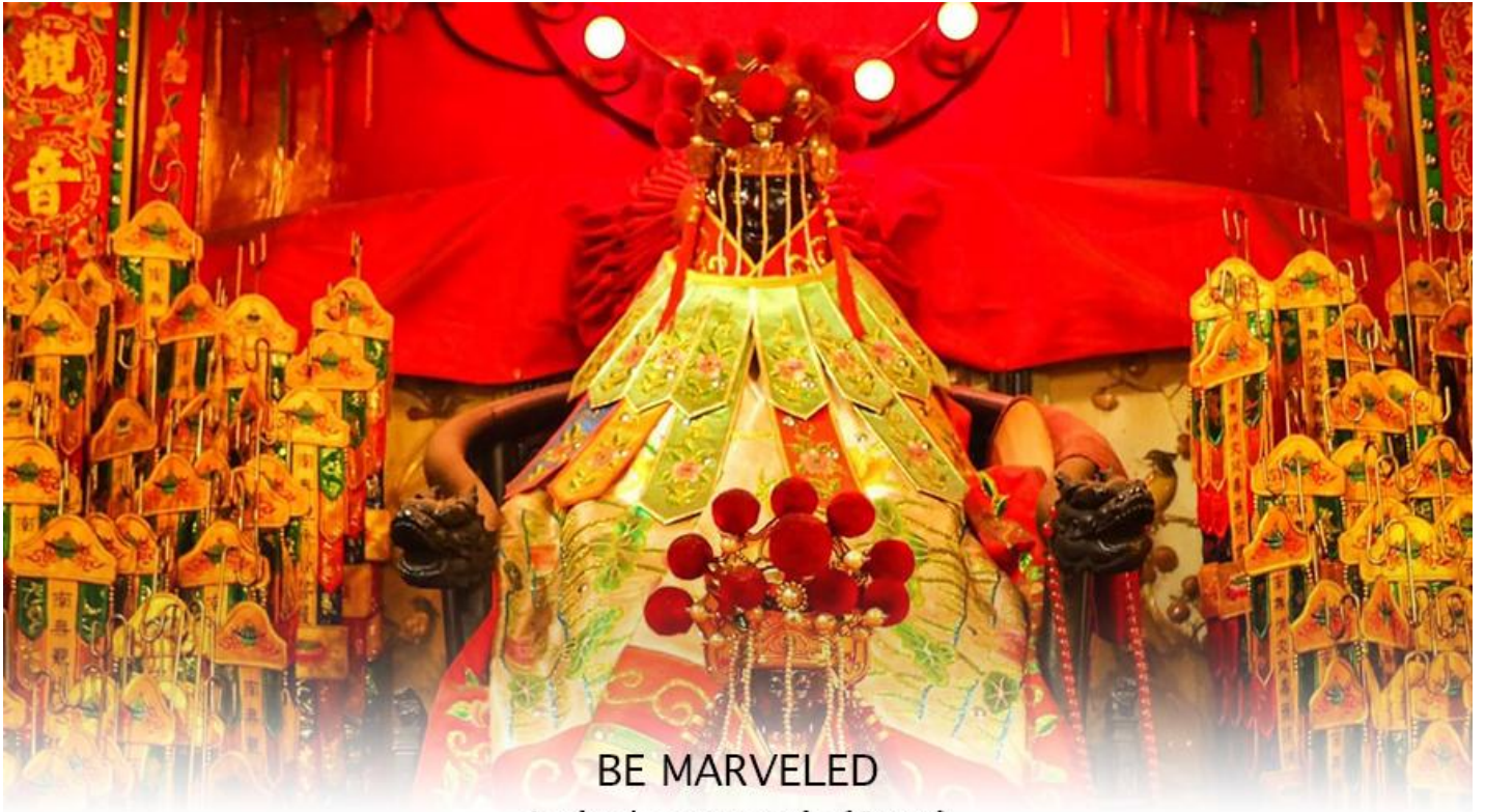
BE MARVELED วัดเจ้าแม่กวนอิมฮวงอ้า (ยิมเิน)

เที่ยง ๑๐ | รับประทานอาหารกลางวัน ณ ภัตตาคาร เมนูพิเศษ ห่านย่าง