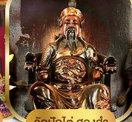
วัดบิกไต่ ฮองอ่า