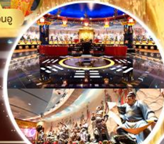
ห้องลับ วัดหวังต้าเซียน

การ์นตรี พักย่านแหล่ง Shopping Tsim Sha Tsui , Mong Kok , Jordan