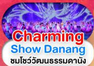
Charming Show Danang ชมโชว์วัฒนธรรมดานัง