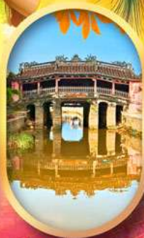
เมืองเก่าฮอยอัน