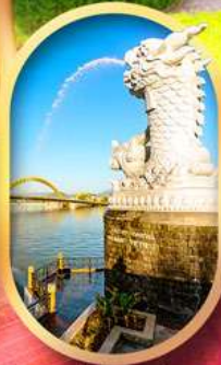
คาร์พดราท็อน