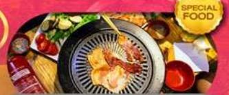
พิเศษเมนู BBQ Buffet เดินทาง มี.ค. - ต.ค. 69