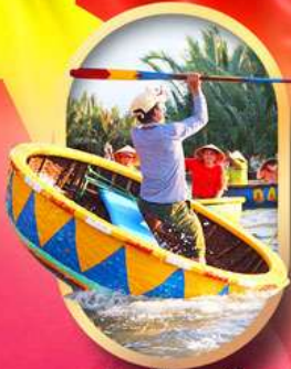
ล่องเรือกระดังง์