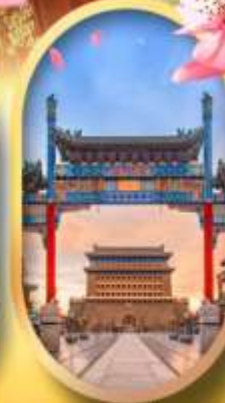
ถนนคนเดินเจียมเหิม