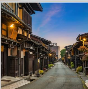
“TAKAYAMA OLD TOWN”