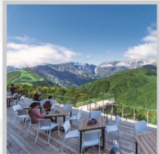
“HAKUBA MOUNTAIN HARBOR”

นำท่านไปโอบกอดธรรมชาติที่ครบครันในที่เดียว “คามิโคจิ” สวิสเซอร์แลนด์แดนญี่ปุ่นเทือกเขาที่ปกคลุมด้วยหิมะสวยงาม ชมความงามของ “ทุ่งพืชมอส ฟุจิชิบะซากุระ” มนต์เสน่ห์..พรมธรรมชาติสีชมพูหลากสีสดใส เปลี่ยนอริยาบท “ขึ้นกระเช้าฮาคุบะ อิวะตะเกะ” เพื่อชมวิวพาโนรามาของเทือกเขาแอลป์ญี่ปุ่นกันให้อิ่มใจ สัมผัสกลิ่นอายเมืองเก่า “เมืองทาคายามา” ที่ยังคงอนุรักษ์ความเป็นอยู่ เมื่อสมัยเอโดะกว่า 300 ปี สายช้อปปิ้งห้ามพลาด “คารุอิซาวะ เอ้าท์เล็ต” แลนด์มาร์กของเมืองคารุอิซาวะ และ “ย่านชินจูกุ” แห่งเมืองโตเกียว ชมความงามกับเส้นทาง “เจแปนแอลป์ (ท่าแพงหิมะ)” สุดยอดของการท่องเที่ยวที่ถูกขนานนามว่า “หลังคาแห่งญี่ปุ่น”