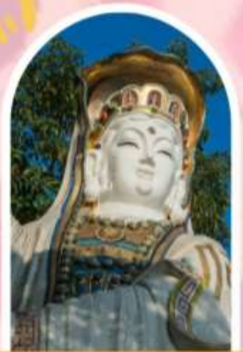
ริพลัสเบย์ รับพลังงานดี เสริมพลังดวงจัญ