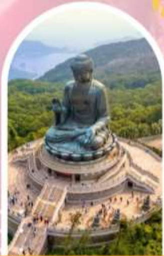
นั่งกระเช้ามองปีง นมัสการพระใหญ่ไป่หวลัน