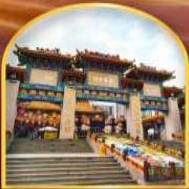
วัดหวังต้าเซียน ขอพรด้านสุขภาพ