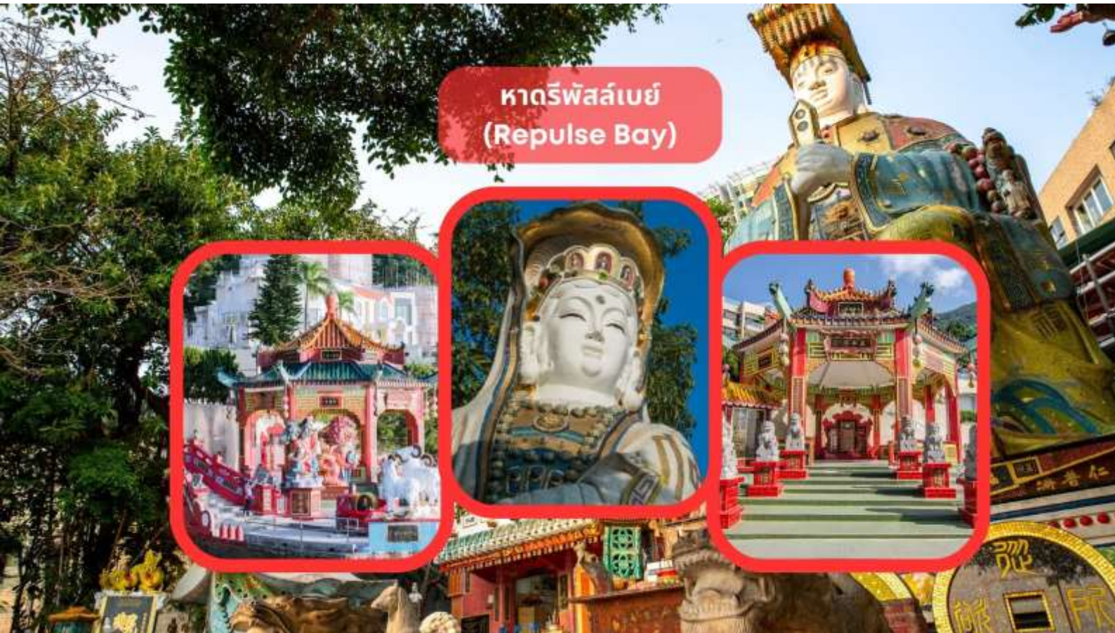
หาดรีพัลส์เบย์ (Repulse Bay)

รับประทานอาหารเช้า ณ ภัตตาคาร บริการท่านด้วยเมนูติ่มซำฮ่องกง (มื้อที่ 3)