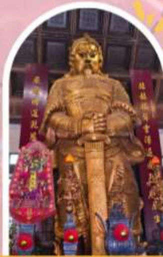
วัดแซกง ขอพรโชคลาก การเงิน และธุรกิจ