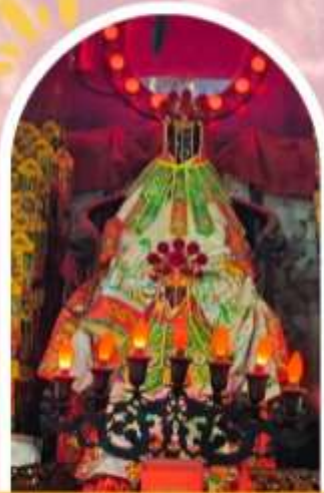
วัดเจ้าแม่กวนอิมอ่องอ่า ขอพรเรื่องเงิน ทรัพย์สิน และความมั่งคั่ง