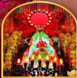
เจ้าแม่กวนอิมฮ่องซ่า ที่มีอายุกว่า 600 ปี

สนุกสนานไปกับสวนสนุกดิสนีย์แลนด์แบบเต็มวัน