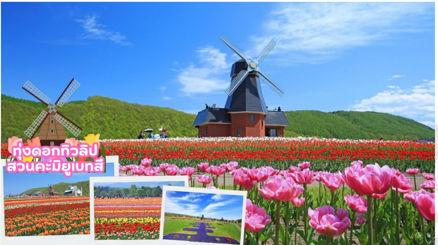
ทุ่งดอกทิวลิป สวนคะมิยูเบทสึ

กลางวัน รับประทานอาหารกลางวัน ณ ร้านอาหาร (มื้อที่ 4)