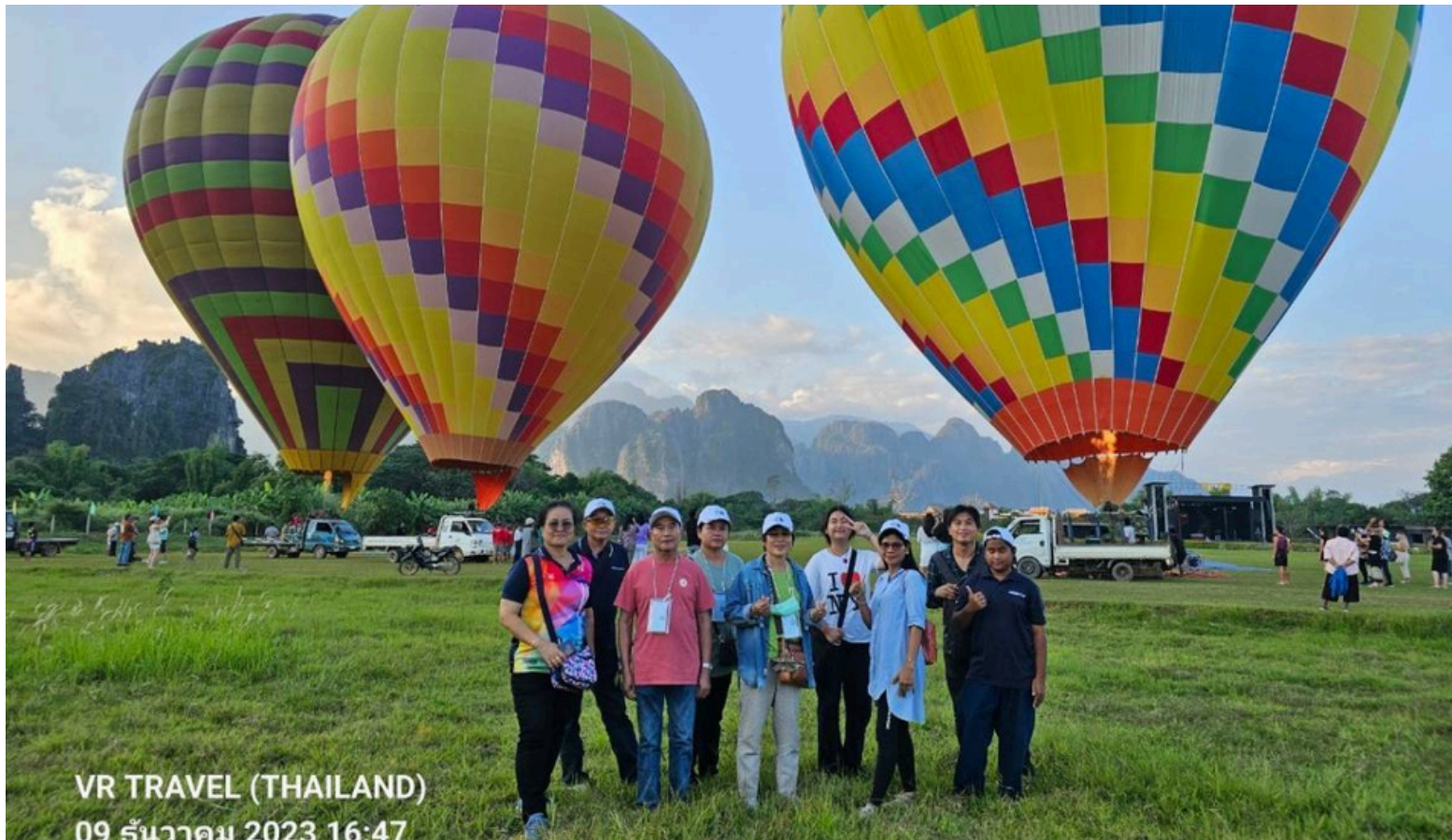
VR TRAVEL (THAILAND) 09 ธันวาคม 2023 16:47

บริการอาหารกลางวัน (มื้อที่ 4) ที่ร้านอาหารวังเวียง อิ่มหนำกันดีแล้วเดินทางต่อถึงเมืองวังเวียง จากนั้นนำคณะ เช็คอินโรงแรมในเมืองวังเวียง (คืนที่ 2) ทุกท่านพักผ่อนตามอัธยาศัย ช่วงเย็นพาไปที่ Sky Club หรือเดินปล่อยบอลลูก ตื่นตาตื่นใจกับลูกโป่งยักษ์ ที่ถูกปล่อยขึ้นบนท้องฟ้าเหนือเมืองวังเวียง นอกจากบอลลูกแล้วยังมีพารามอเตอร์ สำหรับท่านไหนสนใจขึ้นนั่งบอลลูก พารามอเตอร์ สามารถแจ้งที่หัวหน้าทัวร์หรือไกด์ได้ (โดยค่าใช้จ่ายไม่รวมในค่าบริการทัวร์) จากนั้นนำคณะลองเรือน้ำซอง 1 ลำ / 2 ท่าน (ค่าเรือไม่รวมในค่าบริการทัวร์) อิสระอาหารเย็นที่ถนนคนเดินแถวโรงแรม จากนั้นนำทุกท่านกลับเข้าโรงแรม